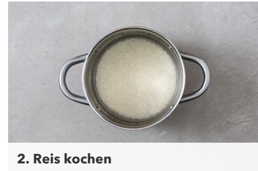
2. Reis kochen

In einem mittelgroßen Topf 600ml leicht gesalzenes Wasser für den Reis zum Kochen bringen. Die Paprika halbieren, entkernen und in feine Streifen schneiden. Die Limettenschale abreiben, dann die Limette halbieren und auspressen.