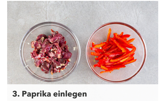
3. Paprika einlegen

Den Reis in einem Sieb unter fließendem Wasser abspülen, bis das Wasser klar bleibt. Sobald das Wasser kocht, den Reis hineingeben und abgedeckt bei niedrigster Hitze 10-12Min. kochen, bis das Wasser aufgesogen und der Reis gar ist. Noch ca. 5Min. ohne Hitzezufuhr ziehen lassen.