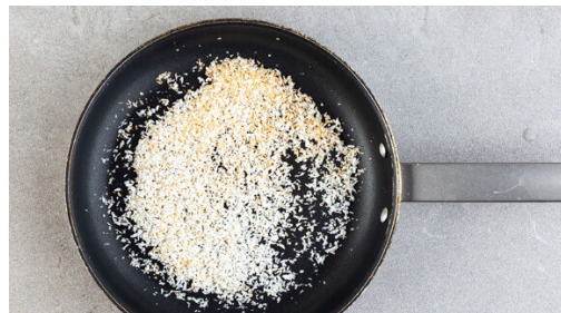
4. Kokosraspel anrösten

Die Paprika mit 1EL Limettensaft , 1TL Limettenabrieb , \frac{1}{2} TL Zucker und 1 Prise Salz vermengen und beiseitestellen. Die Chilischote fein würfeln, für weniger Schärfe ggf. die Kerne entfernen. Den Knoblauch schälen und fein würfeln. Das Fleisch trocken tupfen und mit der Chilischote nach Geschmack , dem Knoblauch , 2EL Pflanzenöl und 1 kräftigen Prise Salz vermengen.