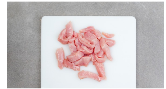
3. Fleisch vorbereiten

Die Pasta in das kochende Wasser geben und in 8-10Min. bissfest kochen. In ein Sieb abgießen und abtropfen lassen, dann die Pasta wieder in den Topf geben und abgedeckt warm halten.