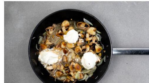
5. Geschnetzeltes zubereiten

Das Fleisch in einer großen Pfanne mit 2EL Olivenöl bei starker Hitze 3-4Min. goldbraun anbraten. Aus der Pfanne nehmen und beiseitestellen.