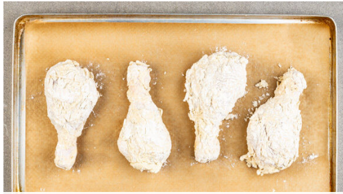
1. Fleisch vorbereiten

Energie 824kcal, Fett 47.5g, Kohlenhydrate 48.5g, Eiweiß 46.0g