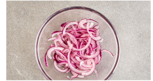
3. Zwiebeln einlegen

In einem mittelgroßen Topf ausreichend gesalzenes Wasser für den Brokkoli zum Kochen bringen. Den Brokkoli in mundgerechte Röschen schneiden, den Strunk ebenfalls klein schneiden, ggf. vorher schälen. Den Brokkoli 4-6Min. kochen, bis er gar, aber noch bissfest ist. Inzwischen den Apfel vierteln, entkernen und in kleine Würfel schneiden.