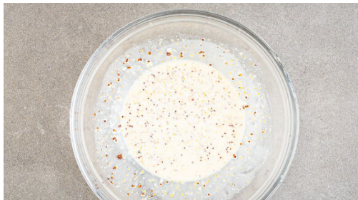
4. Dressing anrühren

Den Backofen auf 230°C (210°C Umluft) vorheizen. Den Joghurt , 1TL Senf und die Gewürzmischung verrühren und mit Salz und Pfeffer abschmecken. Das Fleisch trocken tupfen und mit dem Joghurt vermengen. Das Mehl auf einen tiefen Teller geben, das Fleisch gründlich in dem Mehl wenden und auf einem mit Backpapier ausgelegten Backblech verteilen.