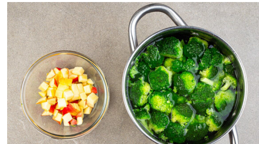
5. Brokkoli garen

Das Fleisch mit 2EL Olivenöl beträufeln, in den noch vorheizenden Ofen schieben und 35-40Min. im Ofen backen. Tipp: Nach der Hälfte der Garzeit ggf. noch etwas Olivenöl über das Fleisch träufeln, um sicherzustellen, dass alle bemehlten Flächen mit Öl bedeckt sind.