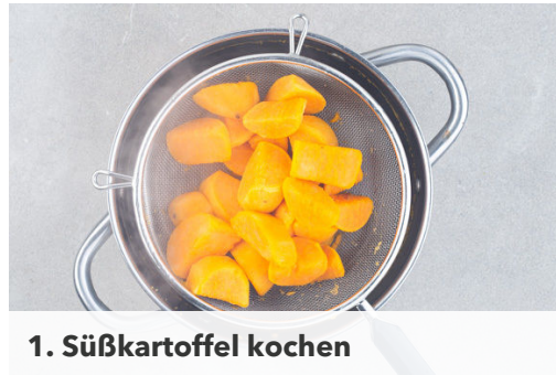
1. Süßkartoffel kochen

Energie 598kcal, Fett 30.2g, Kohlenhydrate 42.3g, Eiweiß 35.5g