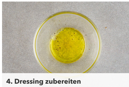
4. Dressing zubereiten

In einem mittelgroßen Topf ausreichend gesalzenes Wasser für die Süßkartoffel zum Kochen bringen. Die Süßkartoffel schälen und in 3-4cm große Stücke schneiden. In das kochende Wasser geben und ca. 15Min. kochen lassen, bis die Süßkartoffeln weich sind. In ein Sieb abgießen, kurz ausdampfen lassen und zurück in den Topf geben.