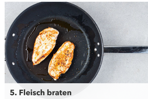
5. Fleisch braten

Die Lauchzwiebel in feine Ringe schneiden. Die ½ des Ingwers oder mehr schälen und fein reiben.