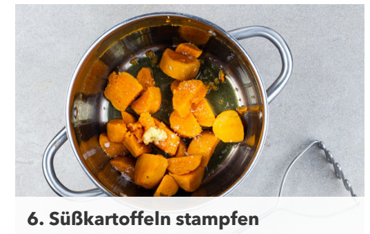
6. Süßkartoffeln stampfen

Den Koriander samt Stängeln fein schneiden und mit dem Joghurt verrühren. Mit 1 Prise Harissa sowie Salz abschmecken.