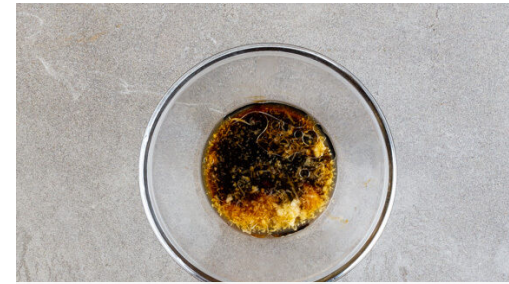
2. Würzsauce anrühren

In einem Wasserkocher ausreichend Wasser für die Nudeln zum Kochen bringen. Den Ingwer und den Knoblauch schälen und fein reiben oder würfeln.