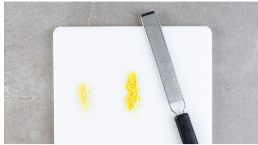
1. Ingwer & Knoblauch reiben

Energie 797kcal, Fett 44.3g, Kohlenhydrate 72.7g, Eiweiß 29.3g