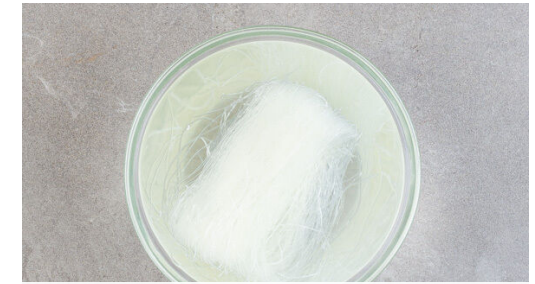
3. Nudeln garen

Die Teriyakisauce mit dem Ingwer , dem Knoblauch , 2EL Pflanzenöl, 2EL hellem Essig sowie je 1 kräftigen Prise Salz und Pfeffer verrühren.