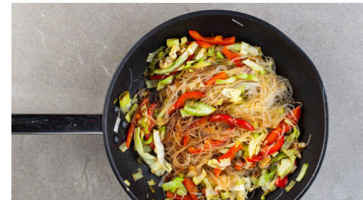
5. Nudelpfanne zubereiten

Den Fisch kalt abspülen, trocken tupfen und evtl. vorhandene Gräten und Schuppen entfernen. Mit je 1 Prise Salz und Pfeffer würzen und in einer großen Pfanne mit 2EL Pflanzenöl auf der Hautseite bei mittlerer bis starker Hitze 3-4Min. anbraten, damit die Haut schön kross wird. Den Fisch wenden, mit 2-3EL Würzsauce beträufeln, die Hitze reduzieren und in 2-3Min. gar ziehen lassen.