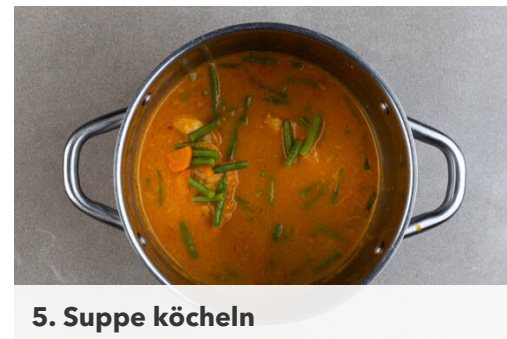
5. Suppe köcheln

Das Fleisch trocken tupfen und in einem mittelgroßen Topf mit 1EL Pflanzenöl bei mittlerer bis starker Hitze ca. 3Min. auf jeder Seite anbraten, bis das Fleisch noch nicht gar, aber von außen gebräunt ist. Aus dem Topf nehmen und beiseitestellen, den Topf samt Bratenfett aufbewahren.