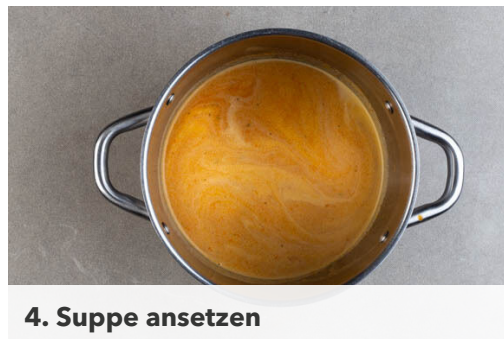
4. Suppe ansetzen

Die Karotte ggf. schälen, längs halbieren und quer in dünne Scheiben schneiden. Den Ingwer und den Knoblauch schälen, dann grob würfeln. Die Tomate ebenfalls grob würfeln. Die Lauchzwiebel in dünne Ringe schneiden. In einem Wasserkocher ausreichend Wasser für die Glasnudeln aufkochen.