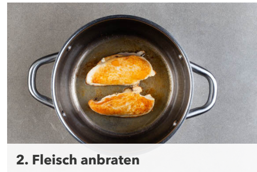
2. Fleisch anbraten

Die Karotten in den Topf geben und bei mittlerer bis starker Hitze 3-4Min. unter Rühren anbraten. Die Würzpaste hinzufügen und 2-3Min. mitbraten, dann mit der Kokosmilch und 400ml Wasser ablöschen. Die ½ des Brühgewürzes oder mehr nach Geschmack einrühren und die Suppe aufkochen.