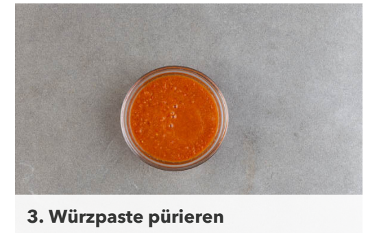
3. Würzpaste pürieren

Die Enden der Bohnen ggf. entfernen. Das Fleisch zurück in den Topf geben, die Bohnen ebenfalls hinzufügen und die Suppe 10-13Min. kochen lassen, bis das Gemüse weich und das Fleisch gar ist. Die Suppe mit 2TL Essig, mehr Brühgewürz oder Salz abschmecken.