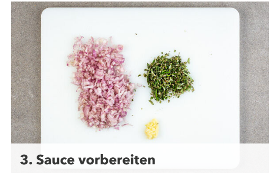
3. Sauce vorbereiten

2EL Butter in derselben Pfanne bei niedriger Hitze schmelzen und die Schalotten , den Knoblauch und den Rosmarin ca. 1Min. anschwitzen, dabei gut rühren und den Bratensatz lösen. Erst 2TL Mehl, dann 200ml Wasser und 2TL Brühgewürz unterrühren und aufkochen. Die Sauce ca. 2Min. eindicken lassen, dann 2EL Crème fraîche unterrühren und bei niedriger Hitze warm halten.