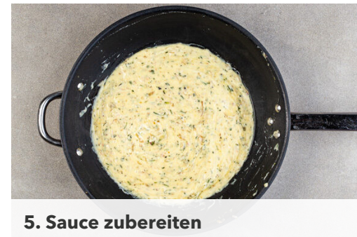
5. Sauce zubereiten

Die Karotten ggf. schälen, längs halbieren und in dünne Scheiben schneiden. Die Karottenscheiben mit 2EL Pflanzenöl und je 1 kräftigen Prise Salz und Pfeffer auf einem mit Backpapier ausgelegten Backblech vermengen und in 20-25Min. goldbraun rösten.