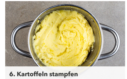
6. Kartoffeln stampfen

Die Schalotten und den Knoblauch schälen und in feine Würfel schneiden. Die Rosmarinnadeln von den Stängeln streifen und fein schneiden.