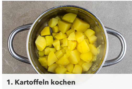
1. Kartoffeln kochen

Energie 728kcal, Fett 39.1g, Kohlenhydrate 55.8g, Eiweiß 34.7g