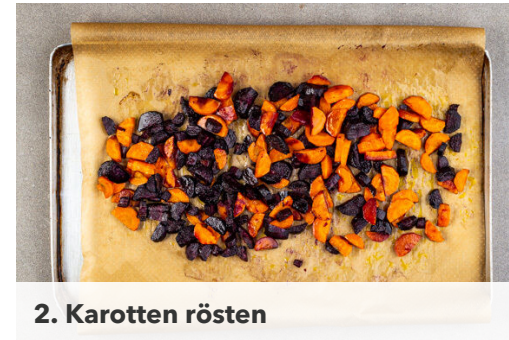
2. Karotten rösten

Verzichte auf gedruckte Rezepte - ändere die Einstellungen im Kundenkonto. Fragen zur Zubereitung oder zum Rezept? Deine Koch-Hotline: 030 208 480 510