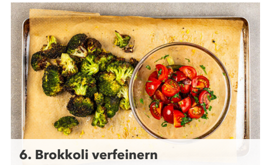
6. Brokkoli verfeinern

Das Fleisch trocken tupfen, horizontal halbieren und zwischen zwei Lagen Backpapier oder Frischhaltefolie z. B. mit einem schweren Topf gleichmäßig ca. 0,5 cm dünn flach klopfen. Von beiden Seiten mit je 1 Prise Salz und Pfeffer würzen.