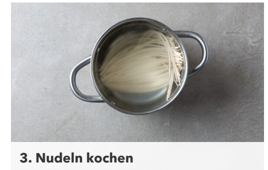
3. Nudeln kochen

Die Karotte ggf. schälen und mit einer Küchenreibe grob raspeln.