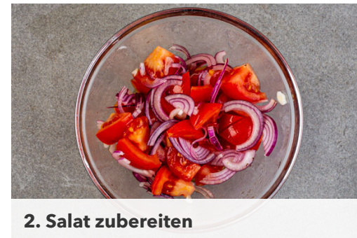
2. Salat zubereiten

In einem großen Topf ausreichend leicht gesalzenes Wasser für die Süßkartoffeln und die Karotten zum Kochen bringen. Die Süßkartoffeln schälen und in ca. 2cm große Stücke schneiden. Die Karotten ggf. schälen und ebenfalls in ca. 2cm große Stücke schneiden. Das Gemüse in den Topf geben und in 10-12Min. gar kochen. In ein Sieb abgießen, das Kochwasser auffangen.