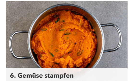
6. Gemüse stampfen

Die Zwiebeln mit 1EL Brühgewürz und 1EL Mehl bestäuben und weitere 1-2Min. braten. Dann mit 500ml Kochwasser ablöschen und 4TL Senf unterrühren. Die Sauce 3-4Min. einköcheln lassen, dann mit Salz und Pfeffer abschmecken und die Pfanne vom Herd nehmen. Das Fleisch in die Sauce geben, um es warm zu halten.