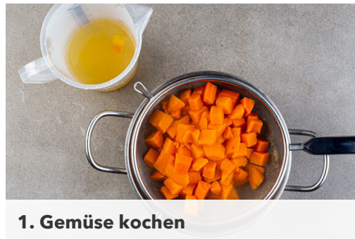
1. Gemüse kochen

Energie 617kcal, Fett 27.2g, Kohlenhydrate 52.4g, Eiweiß 35.1g