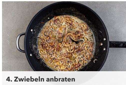
4. Zwiebeln anbraten

Das Fleisch trocken tupfen, jeweils in 6 gleich große Medaillons schneiden und mit je 1 kräftigen Prise Salz und Pfeffer würzen. Die Medaillons in einer großen Pfanne mit 2EL Olivenöl bei starker Hitze auf jeder Seite 2-3Min. braten. Aus der Pfanne nehmen und bis zum Servieren auf einem Teller abgedeckt ruhen lassen.