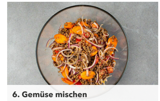
6. Gemüse mischen

Das Fleisch trocken tupfen und jeweils horizontal halbieren. Jedes Stück noch einmal der Länge nach durchschneiden und auf je 1 Scheibe Bacon legen. Mit den getrockneten Feigen belegen und das Fleisch fest zu kleinen Rouladen aufrollen. Tipp: Wer mag, kann die Involtini mit Zahnstochern fixieren.