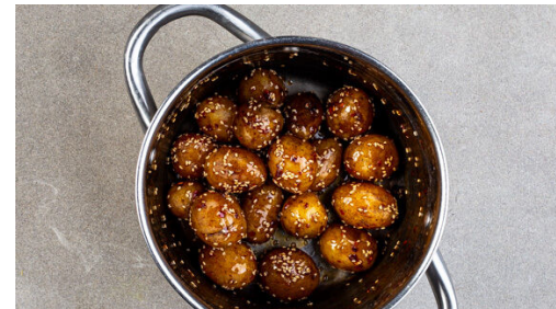
5. Kartoffeln würzen

Den Knoblauch schälen und fein würfeln. Das Hackfleisch in einer großen Pfanne mit 1EL Pflanzenöl bei starker Hitze ca. 2Min. scharf anbraten. Den Gemüsemix sowie die ½ des Knoblauchs zugeben und bei mittlerer Hitze 5-7Min. unter Rühren mitbraten.