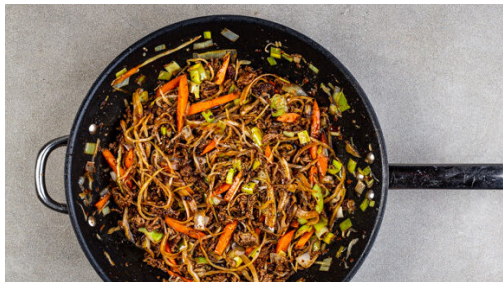
4. Sauce zugeben

Die Kartoffeln samt Schale in einem mittelgroßen Topf mit ausreichend gesalzenem Wasser zum Kochen bringen und in 13-16Min. gar kochen.