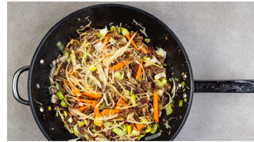
2. Füllung vorbereiten

Die Ingwer-Würzsauce sowie 50ml Wasser mit der Hackfleischfüllung in der Pfanne verrühren. Mit Salz und Pfeffer abschmecken.