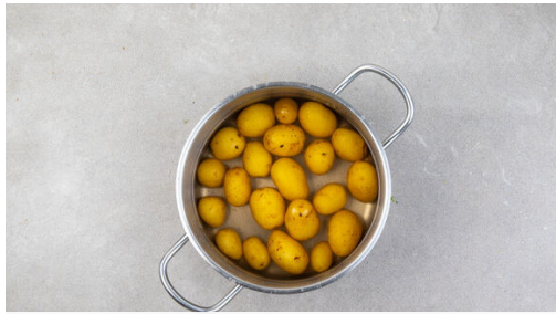
1. Kartoffeln kochen

Energie 1055kcal, Fett 45.7g, Kohlenhydrate 118.7g, Eiweiß 40.1g