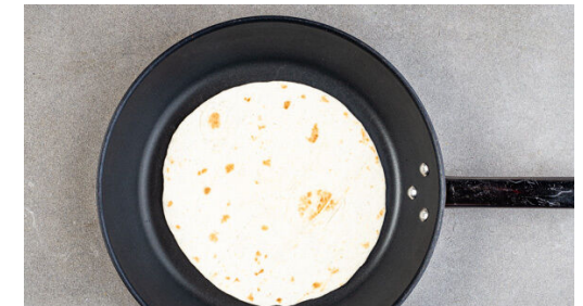
6. Tortillas erwärmen

Die Gurke längs vierteln, dann quer in Scheiben schneiden. Die Lauchzwiebel in feine Ringe schneiden und mit den Gurken , dem Sesamöl und 1EL hellem Essig vermengen. Den Gurkensalat mit Salz und Pfeffer abschmecken.