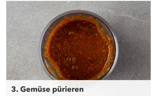
3. Gemüse pürieren

Die veganen Hähnchenschnitzel , die ½ der Paprika und die Zwiebeln in einer mittelgroßen Pfanne mit 1EL Pflanzenöl bei mittlerer Hitze 5-8Min. braten, bis die Zwiebeln goldbraun und weich sind. In einem kleinen Topf 300ml leicht gesalzenes Wasser für den Couscous zum Kochen bringen.