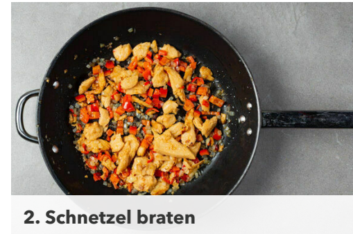
2. Schnitzel braten

Die Paprika vierteln, entkernen und in kleine Würfel schneiden. Die Zwiebel schälen, halbieren und fein würfeln.