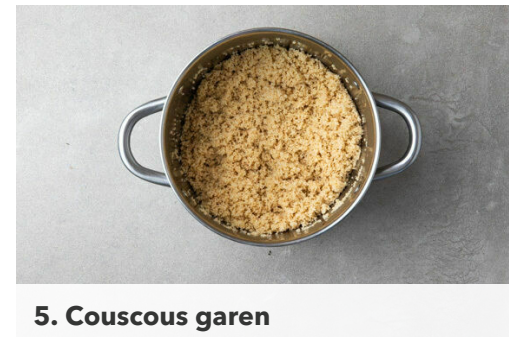
5. Couscous garen

Das pürierte Gemüse in die Pfanne gießen und die Sauce bei mittlerer bis niedriger Hitze 10-15Min. einköcheln lassen.