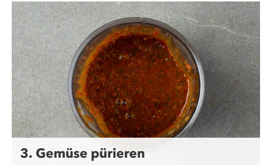
3. Gemüse pürieren

Die veganen Hähnchenschnitzel , die ½ der Paprika und die Zwiebeln in einer großen Pfanne mit 2EL Pflanzenöl bei mittlerer Hitze 5-8Min. braten, bis die Zwiebeln goldbraun und weich sind. In einem mittelgroßen Topf 600ml leicht gesalzenes Wasser für den Couscous zum Kochen bringen.