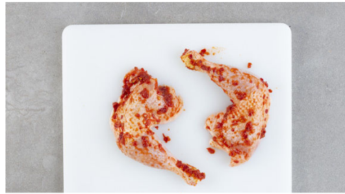
1. Hähnchen würzen

Energie 870kcal, Fett 43.3g, Kohlenhydrate 67.4g, Eiweiß 46.7g