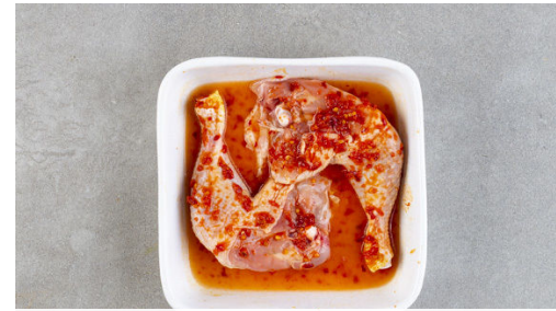
2. Hähnchen garen

Die Birnen vierteln, vom Kerngehäuse befreien und in möglichst kleine Würfel schneiden. Die Lauchzwiebeln in feine Ringe schneiden. Die Petersilie samt Stängeln fein hacken. Die Rosinen ebenfalls fein hacken.