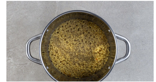
3. Bulgur garen

Die Gurke längs halbieren und quer in dünne Scheiben schneiden. 3EL Olivenöl, 2EL Essig sowie je 1 kräftige Prise Salz, Pfeffer und Zucker zu einem Dressing verrühren und die Gurken untermengen. Den Gurkensalat ca. 5Min. ziehen lassen, dann die ½ der Lauchzwiebeln und ca. ¼ der Petersilie untermischen. Nach Geschmack mit Salz und Pfeffer nachwürzen.