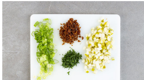
4. Birnen schneiden

Den Backofen auf 240°C (220°C Umluft) vorheizen. In einem mittelgroßen Topf 600ml Wasser für den Bulgur zum Kochen bringen. Die Hähnchenteile trocken tupfen und rundum mit der Sriracha-Sauce und 1 kräftigen Prise Salz einreiben.