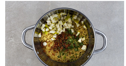
6. Bulgur verfeinern

Ca. ¼ der Gewürzmischung und das Brühgewürz in das kochende Wasser geben, dann den Bulgur untermischen und abgedeckt bei niedriger Hitze 8-10Min. sanft köcheln lassen, bis das Wasser aufgesaugt und der Bulgur gar ist. Noch ca. 5Min. ohne Hitzezufuhr ziehen lassen.