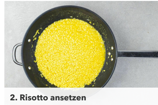
2. Risotto ansetzen

Nebenher die Karotten ggf. schälen, in 1-2cm breite, schräge Scheiben schneiden und mit 1EL Honig sowie 2EL Olivenöl vermengen. Auf einem mit Backpapier ausgelegten Backblech verteilen und 8-10Min. im Ofen unter dem Grill rösten bzw. backen.