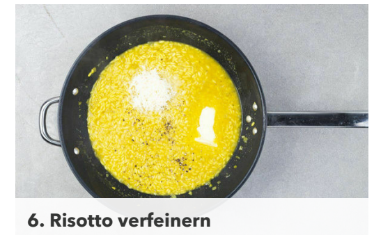
6. Risotto verfeinern

Den Reis in der Pfanne nach und nach mit etwas Brühe begießen. Kontinuierlich rühren, bis der Reis die Flüssigkeit aufgenommen hat, erst dann wieder Brühe nachgießen. Den Vorgang wiederholen, bis die Brühe aufgebraucht und der Reis gar ist, das dauert 18-20Min.