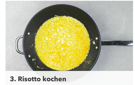
3. Risotto kochen

Die Mandeln grob hacken und mit dem Panko-Paniermehl in einer kleinen Pfanne mit 1EL Olivenöl bei mittlerer bis niedriger Hitze ca. 2Min. anrösten. Vorsicht , die Mandeln können schnell zu dunkel werden. Den Käse fein reiben.