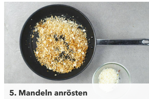
5. Mandeln anrösten

Die Zwiebeln in einer großen Pfanne mit 1EL Olivenöl bei mittlerer Hitze 1-2Min. glasig anschwitzen. Den Reis hinzufügen und ca. 1Min. leicht anrösten, dann mit dem Safranwasser und 2TL hellem Essig ablöschen und den Reis weitere 1-2Min. braten.