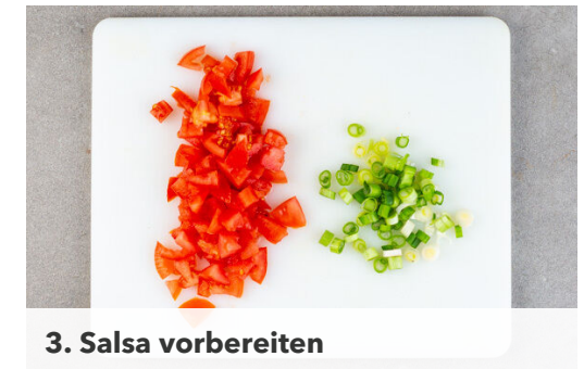
3. Salsa vorbereiten

Die Süßkartoffelwürfel und die Karottenscheiben in das kochende Wasser geben und in 10-12Min. gar kochen.