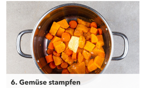
6. Gemüse stampfen

Die Tomaten und die Lauchzwiebeln mit 1TL Essig vermengen. Mit Salz, Pfeffer und Zucker abschmecken.