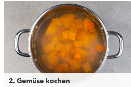
2. Gemüse kochen

In einem mittelgroßen Topf ausreichend gesalzenes Wasser für das Gemüse zum Kochen bringen. Die Süßkartoffeln schälen und in ca. 2cm große Würfel schneiden. Die Karotte ggf. schälen und in ca. 2cm dicke Scheiben schneiden.