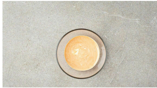
1. Dip anrühren

Energie 577kcal, Fett 30.0g, Kohlenhydrate 40.9g, Eiweiß 36.8g