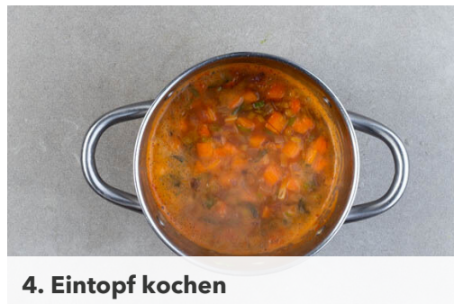
4. Eintopf kochen

In einem großen Topf 2EL Pflanzenöl bei starker Hitze erwärmen. Den Lauch , die Zwiebeln , die Karotten und die Knoblauchscheibchen in das heiße Öl geben, mit 2EL Mehl bestäuben und 2-3Min. scharf anbraten, bis leichte Röstspuren zu sehen sind.