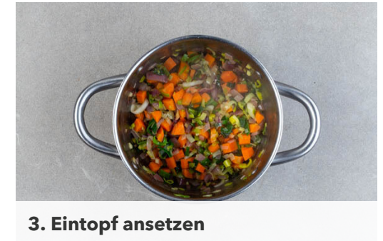
3. Eintopf ansetzen

Die Karotten ggf. schälen, längs vierteln und in kleine Würfel schneiden. Den Knoblauch schälen, 2 Knoblauchzehen in feine Scheibchen schneiden, den übrigen Knoblauch durch eine Knoblauchpresse drücken oder sehr fein würfeln. Die Bohnen in einem Sieb kalt abspülen und abtropfen lassen.