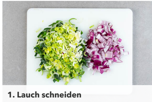
1. Lauch schneiden

Energie 588kcal, Fett 29.7g, Kohlenhydrate 34.7g, Eiweiß 37.2g