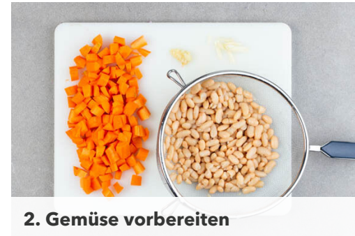
2. Gemüse vorbereiten

Den Lauch längs halbieren und in feine Streifen schneiden. Die Zwiebeln schälen, halbieren und grob würfeln.