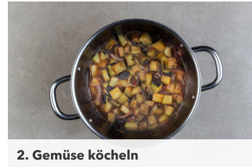
2. Gemüse köcheln

Die Auberginen in ca. 2cm große Würfel schneiden. Die Zwiebel schälen, halbieren und in ca. 1cm breite Streifen schneiden.