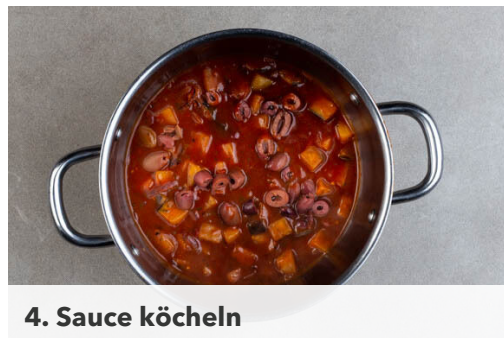
4. Sauce köcheln

Den Bacon ohne Zugabe von Fett gleichmäßig in einer mittelgroßen Pfanne verteilen und bei mittlerer bis starker Hitze 5-6Min. braten, bis er knusprig ist, dabei regelmäßig wenden. Den Bacon aus der Pfanne nehmen und auf etwas Küchenpapier abtropfen lassen. Die Pfanne mit dem Bratenfett aufbewahren.