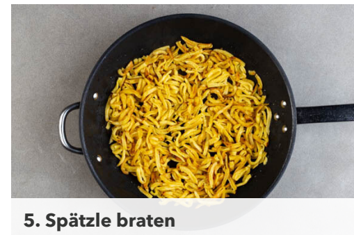
5. Spätzle braten

Die Tomatensauce und ½EL Balsamicoessig zum Gemüse geben und bei mittlerer bis starker Hitze ca. 2Min. einköcheln lassen. Die Oliven grob schneiden und mit in den Topf geben. Mit Salz und Pfeffer abschmecken.