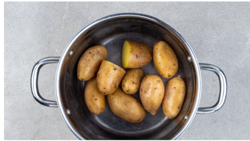
1. Kartoffeln kochen

Energie 1049kcal, Fett 60.5g, Kohlenhydrate 80.8g, Eiweiß 41.5g