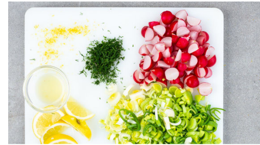
2. Zutaten vorbereiten

100ml kaltes Wasser mit 1TL Backpulver und 80g Mehl verrühren und den Teig mit je 1 kräftigen Prise Salz und Pfeffer würzen. Tipp: Wer den Messbecher sparen möchte, kann auch 100g Wasser abwägen. Für das Dressing die Crème fraîche mit der Zitronenschale , dem Zitronensaft , 1EL Mayonnaise und 1 EL Senf verrühren.