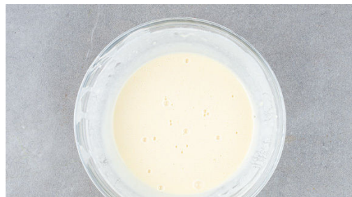
4. Backteig anrühren

Die Kartoffeln samt Schale je nach Größe ggf. halbieren, in einem mittelgroßen Topf mit leicht gesalzenem Wasser bedecken und bei starker Hitze zum Kochen bringen. Dann abgedeckt bei niedriger bis mittlerer Hitze 15-20Min. kochen, bis die Kartoffeln gar sind. Die Kartoffeln in ein Sieb abgießen und abkühlen lassen.