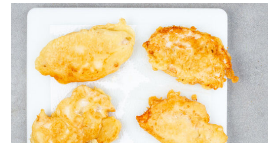
6. Schnitzel ausbacken

Das Fleisch trocken tupfen, in 2 gleich große Stücke schneiden und diese quer zu insgesamt 4 Schnitzeln halbieren. Die Schnitzel mit einem Fleischklopfer oder dem Boden einer schweren Pfanne ca. 0,5cm dünn plattieren.