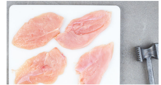
3. Fleisch vorbereiten

Den Lauch in einer großen Pfanne mit 1EL Pflanzenöl bei starker Hitze ca. 2Min. scharf anbraten. Die Kartoffeln pellen, in dünne Scheiben schneiden und vorsichtig mit der Mayonnaisecreme vermengen. Mit Essig, Salz und Pfeffer abschmecken, dann die Radieschen , den Lauch und den Dill unterheben. Den Salat nach Belieben mit Salz und Pfeffer nachwürzen.