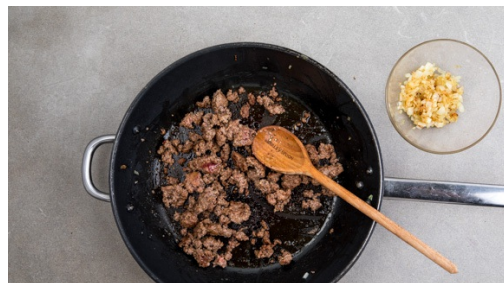
4. Fleisch anbraten

Den Backofen mit Grillfunktion oder Ober-/Unterhitze auf 250°C vorheizen. In einem mittelgroßen Topf ausreichend gesalzenes Wasser für die Kartoffeln zum Kochen bringen. Die Kartoffeln schälen und je nach Größe halbieren oder vierteln. In das kochende Wasser geben und in 10-15Min. gar kochen, dann in ein Sieb abgießen.