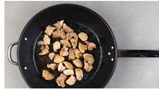
2. Fleisch anbraten

Die Nudeln in das kochende Wasser geben und in 2-3Min. bissfest kochen, dabei zwischendurch umrühren, um die Nudeln voneinander zu trennen. Inzwischen die Lauchzwiebeln in feine Ringe schneiden. Mit einem Messbecher 200ml Nudelwasser abschöpfen, dann die Nudeln in ein Sieb abgießen und kalt abschrecken.