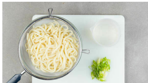
4. Nudeln kochen

In einem mittelgroßen Topf ausreichend gesalzenes Wasser für die Nudeln zum Kochen bringen. Den Käse fein reiben. 2 Eier vorsichtig aufbrechen und die Eigelbe vom Eiweiß trennen. In einer großen Schüssel die Eigelbe mit dem Käse zu einer Paste verrühren. Tipp: Die Eiweiße einfrieren und für ein anderes Rezept aufbewahren.