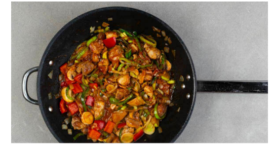
3. Gemüse mitbraten

Die Nudeln und 100ml Nudelwasser in die Pfanne geben und bei starker Hitze ca. 1Min. vorsichtig mit dem Gemüse und dem Fleisch vermengen.