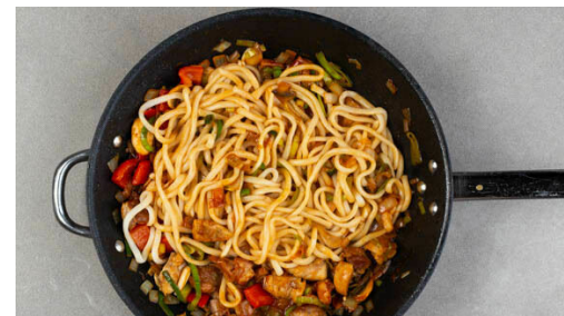
5. Nudeln vermengen

Das Fleisch trocken tupfen, in 2-3cm große Stücke schneiden und in einer großen Pfanne mit 1EL Pflanzenöl bei mittlerer bis starker Hitze auf jeder Seite ca. 2Min. anbraten. Mit 1 kräftigen Prise Salz würzen.