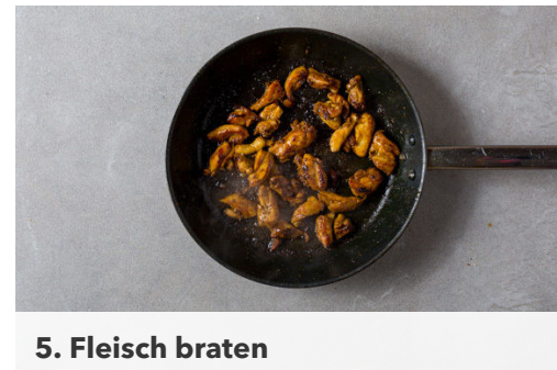
5. Fleisch braten

Die Karotten ggf. schälen und mit einer Küchenreibe grob raspeln.