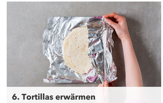
6. Tortillas erwärmen

Die Lauchzwiebeln in feine Ringe schneiden. Die Gurken längs halbieren und ggf. mit einem Löffel das Kerngehäuse auskratzen. Die Gurkenhälften in dünne Scheiben schneiden.