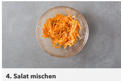
4. Salat mischen

Den Backofen auf 200°C (180°C Umluft) vorheizen. Das Fleisch trocken tupfen und in ca. 1cm dicke Scheiben schneiden. Mit der Teriyakisauce und dem Currypulver vermengen und beiseitestellen.