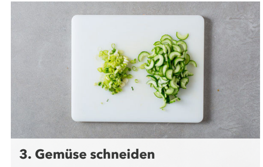
3. Gemüse schneiden

Das Fleisch in einer großen Pfanne bei mittlerer bis starker Hitze auf jeder Seite 3-4Min. braten, bis es goldbraun und gar ist.