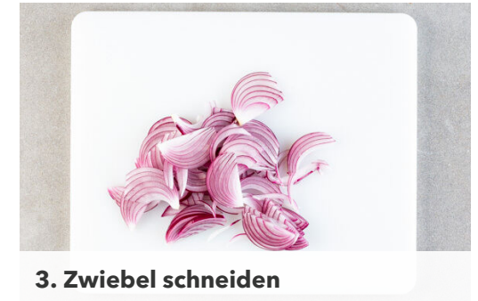
3. Zwiebel schneiden

Die Kartoffeln , die Karotten , die Rote Bete und den Rosmarin auf einem mit Backpapier ausgelegten Backblech mit 1EL Olivenöl, ½TL Salz und 1 Prise Pfeffer vermengen, gleichmäßig verteilen und ca. 20Min. im Ofen rösten, bis das Gemüse gar und appetitlich gebräunt ist. Nach der Hälfte der Zeit einmal durchmischen.