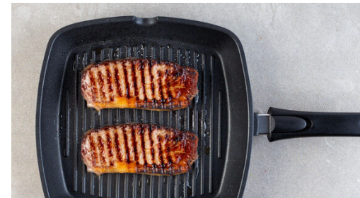
5. Fleisch braten

Die Zwiebeln in einem mittelgroßen Topf mit 1EL Olivenöl, 2TL Zucker und ½TL Salz bei mittlerer Hitze ca. 2Min. anschwitzen. Mit 2TL Mehl bestäuben und ca. 30Sek. untermischen, dann mit 4EL Balsamicoessig und 200ml Wasser ablöschen und die Sauce 7-8Min. sanft einkochen lassen.