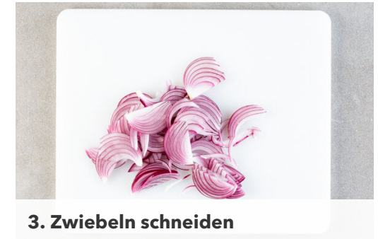
3. Zwiebeln schneiden

Die Kartoffeln , die Karotten , die Rote Bete und den Rosmarin auf einem mit Backpapier ausgelegten Backblech mit 2EL Olivenöl, 1TL Salz und 1 Prise Pfeffer vermengen, gleichmäßig verteilen und ca. 20Min. im Ofen rösten, bis das Gemüse gar und appetitlich gebräunt ist. Nach der Hälfte der Zeit einmal durchmischen.