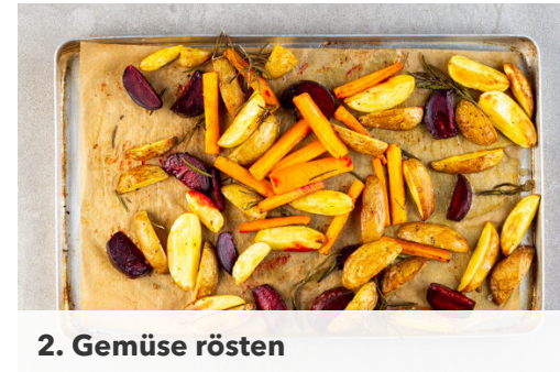
2. Gemüse rösten

Den Backofen auf 230°C (210°C Umluft) vorheizen. Die Kartoffeln samt Schale je nach Größe halbieren oder vierteln. Die Karotten ggf. schälen, längs vierteln und die Stifte dann quer halbieren. Die Rote Bete schälen und in ca. 1cm breite Spalten schneiden. Tipp: Da Rote Bete stark färbt, beim Verarbeiten am besten Küchenhandschuhe und Schürze tragen.