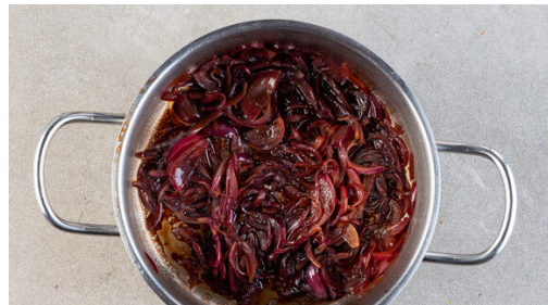
4. Sauce zubereiten

Die Zwiebeln schälen, halbieren und in feine Streifen schneiden.