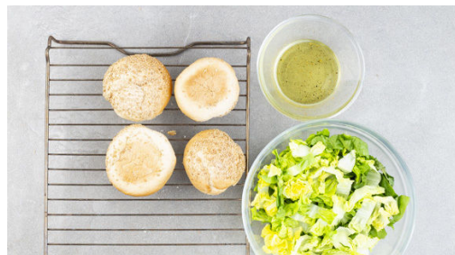
4. Salat vorbereiten

Den Backofen auf 230°C (210°C Umluft) vorheizen. Die Birne vierteln, den Strunk und das Kerngehäuse entfernen, dann der Länge nach in ca. 0,5cm dünne Scheiben schneiden. Die Tomate vierteln, entkernen und in sehr kleine Würfel schneiden.