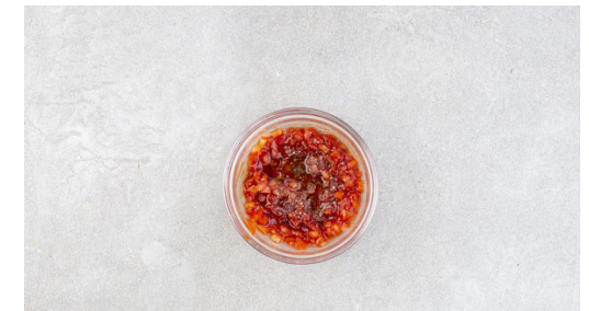
3. Dip anrühren

Das Fleisch trocken tupfen und waagrecht halbieren, sodass 2 Schnitzel entstehen. Diese ggf. etwas dünner klopfen und mit Salz und Pfeffer würzen, dann in einer mittelgroßen Pfanne mit 1EL Olivenöl bei starker Hitze auf jeder Seite 1-2Min. scharf anbraten, bis das Fleisch durch ist. Auf einem Teller abgedeckt beiseitestellen.