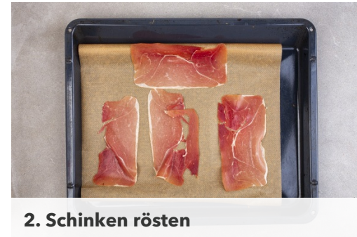
2. Schinken rösten

Den Backofen auf 200°C (180°C Umluft) vorheizen. Die Lauchzwiebel schräg in feine Ringe schneiden.