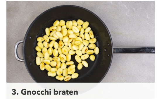
3. Gnocchi braten

Die Schinkenscheiben nebeneinander auf ein mit Backpapier ausgelegtes Backblech legen und im Ofen 8-10Min. backen, bis der Schinken knusprig ist.