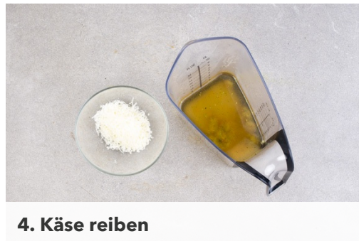
4. Käse reiben

Die Gnocchi in einer großen Pfanne mit 2EL Olivenöl bei mittlerer Hitze 6-8Min. goldbraun anbraten.