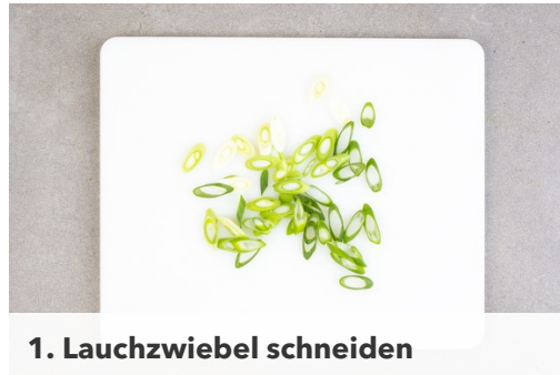
1. Lauchzwiebel schneiden

Energie 895kcal, Fett 46.6g, Kohlenhydrate 86.9g, Eiweiß 31.7g