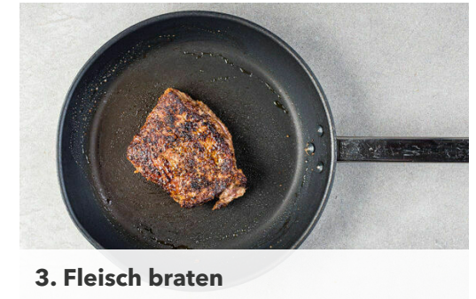
3. Fleisch braten

Die Karotten ggf. schälen und grob raspeln. Die Paprika vierteln, entkernen und in dünne Streifen schneiden. Die Karotten und die Paprika mit 1/2TL Salz und 1EL hellem Essig vermengen und beiseitestellen. Die Tomaten in dünne Spalten schneiden.