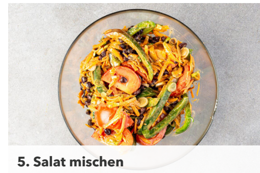
5. Salat mischen

Die 1/2 der Chiliflocken und das restliche Currypulver in einem kleinen Topf mit 1EL Pflanzenöl bei mittlerer bis niedriger Hitze ca. 30Sek. anbraten. Die Erdnussbutter , die Worcestershiresauce , 80ml Wasser, 1EL hellen Essig und 1TL Honig hinzufügen und unter ständigem Rühren erwärmen, bis das Erdnussdressing eingedickt ist, dann vom Herd nehmen.