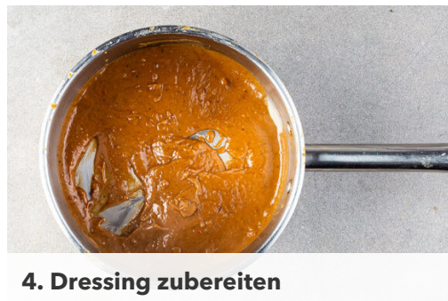
4. Dressing zubereiten

Das Fleisch in einer mittelgroßen Pfanne mit 1EL Pflanzenöl bei starker Hitze auf jeder Seite 2–4Min. scharf anbraten, je nach Dicke des Fleisches . Die Hitze reduzieren und das Fleisch noch 1–3Min. abgedeckt garen, je nachdem, ob es medium oder durch sein soll. Das Fleisch abgedeckt auf einem Teller ruhen lassen.