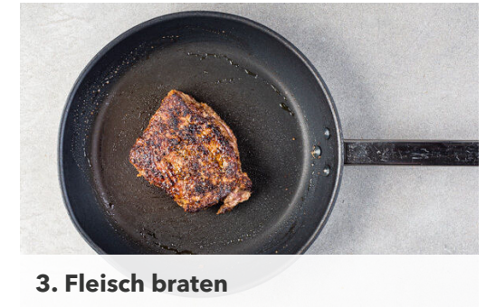
3. Fleisch braten

Die Karotte ggf. schälen und grob raspeln. Die Paprika vierteln, entkernen und in dünne Streifen schneiden. Die Karotten und die Paprika mit 1/2TL Salz und 1EL hellem Essig vermengen und beiseitestellen. Die Tomate in dünne Spalten schneiden.