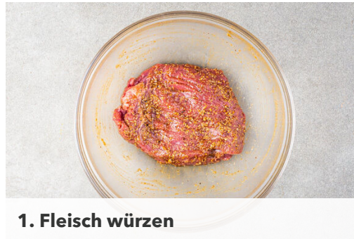
1. Fleisch würzen

Energie 674kcal, Fett 35.5g, Kohlenhydrate 34.3g, Eiweiß 44.4g