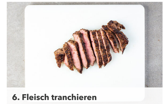
6. Fleisch tranchieren

Die Bohnen in einem Sieb mit kaltem Wasser abspülen und abtropfen lassen. Die Lauchzwiebel in dünne Ringe schneiden. Die Bohnen und 3/4 der Lauchzwiebeln mit den Karotten , der Paprika , den Tomaten und dem Erdnussdressing vermengen.