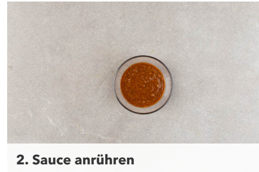
2. Sauce anrühren

Die Nudeln in das kochende Wasser geben und in ca. 5Min. bissfest kochen. Nach ca. 2Min. die Pak-Choi-Blätter zugeben und für mindestens 3Min. im Nudelwasser blanchieren.