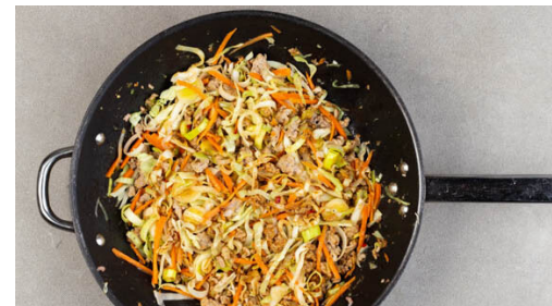
5. Gemüse anbraten

Den Knoblauch schälen und sehr fein würfeln. Die ½ der Tahinipaste mit 3EL Wasser, dem Zitronensaft , der Zitronenschale , der ½ der Hoisinsauce , der ½ der Peperoni , dem Knoblauch , der ½ der Fenchelsamen , 1TL (frisch gemahlenem) Pfeffer und je 1 kräftigen Prise Salz und Zucker zu einer Sauce verrühren. Nach Geschmack mehr Peperoni verwenden.