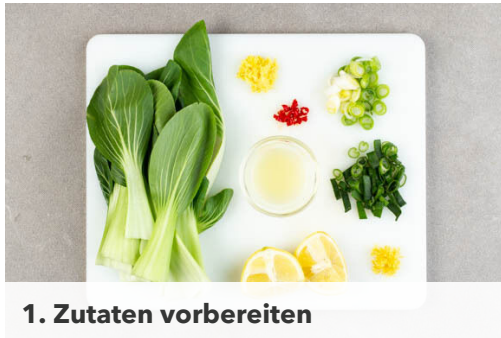
1. Zutaten vorbereiten

Energie 872kcal, Fett 28.6g, Kohlenhydrate 117.0g, Eiweiß 41.8g