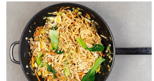
6. Nudeln hinzufügen

In einem mittelgroßen Topf ausreichend gesalzenes Wasser für die Nudeln zum Kochen bringen. Das Hackfleisch , die weißen Lauchzwiebelringe und den Ingwer in einer großen Pfanne oder einem Wok mit 1EL Pflanzenöl, ½TL Salz und 1 Prise Pfeffer bei mittlerer bis starker Hitze 3-4Min. anbraten, bis das Hackfleisch zu bräunen beginnt.