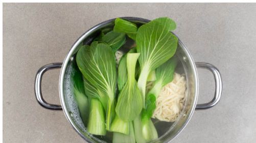
4. Nudeln & Pak Choi garen

Den Strunk des Pak Choi entfernen und die Blätter voneinander trennen. Den weißen Teil und den grünen Teil der Lauchzwiebel getrennt in feine Ringe schneiden. Den Ingwer ggf. schälen und fein reiben oder würfeln. Die Peperoni entkernen und fein würfeln. Die ½ der Zitronenschale abreiben, die ½ der Zitrone auspressen, die andere ½ in Spalten schneiden.