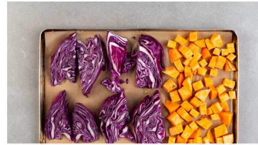
2. Gemüse rösten

Den Backofen auf 220°C (200°C Umluft) vorheizen. Die Chiliflocken mit 2EL heißem Wasser bedecken und einweichen lassen. Die Rotkohle in jeweils 8 Spalten schneiden und auf einem mit Backpapier ausgelegten Backblech mit 2EL Pflanzenöl und ½TL Salz einreiben.