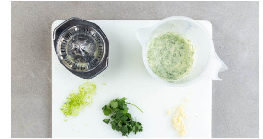
3. Dressing pürieren

Die Süßkartoffeln schälen, in 2-3cm große Würfel schneiden und auf einem weiteren mit Backpapier ausgelegten Backblech mit 2TL Pflanzenöl sowie 1 kräftigen Prise Salz vermengen. Das Gemüse im Ofen 18-24Min. rösten, bis der Rotkohl Röstspuren aufweist und die Süßkartoffeln goldbraun sind. Zur Hälfte der Zeit die Position der Bleche tauschen.