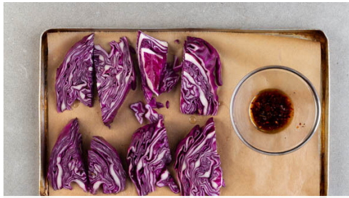
1. Rotkohl vorbereiten

Energie 766kcal, Fett 49.4g, Kohlenhydrate 37.3g, Eiweiß 40.9g