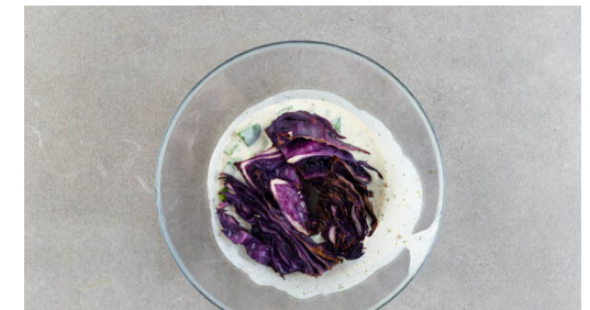
6. Salat fertigstellen

Den restlichen Knoblauch , die Gewürzmischung , 4TL Limettensaft , 4TL Honig und 2EL Wasser zu einer Würzsauce verrühren. Das Fleisch trocken tupfen und in einer großen Pfanne mit 2EL Pflanzenöl und ½TL Salz bei starker Hitze ca. 2Min. auf jeder Seite goldbraun anbraten. Die Sauce angießen und bei niedriger Hitze ca. 3Min. einköcheln lassen.