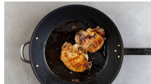
5. Fleisch braten

Das Dressing mit dem Joghurt , der ½ des Knoblauchs , den Chiliflocken sowie der Limettenschale verrühren und mit Salz abschmecken. Die Paprika vierteln und entkernen, in 1-2cm große Stücke schneiden und mit dem Dressing vermengen.