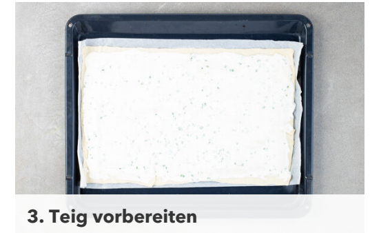
3. Teig vorbereiten

Den übrigen Schnittlauch mit je 1EL Olivenöl, Essig und Wasser sowie je 1 Prise Salz und Zucker zu einem Dressing verrühren.