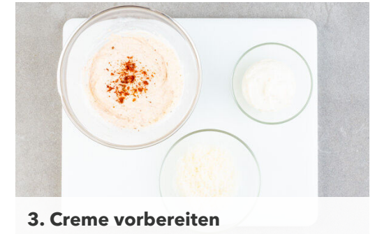
3. Creme vorbereiten

Die Tomaten in kleine Würfel schneiden. 1EL Korianderblätter für die Garnitur aufbewahren, den restlichen Koriander samt Stängeln fein schneiden und mit den Tomaten vermengen. Aus 2EL Olivenöl, 1-2EL Limettensaft sowie je 1 Prise Zucker, Salz und Pfeffer ein Dressing anrühren und kurz vor dem Servieren mit den Tomaten mischen.