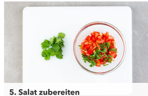
5. Salat zubereiten

Den Knoblauch in einer großen Pfanne mit 2EL Olivenöl bei niedriger Hitze ca. 1Min. anschwitzen. Den Spinat zugeben und 1-2Min. mitbraten, bis der Spinat zusammengefallen ist. Mit je 1 kräftigen Prise Salz und Pfeffer würzen. Überschüssiges Wasser aus der Pfanne vorsichtig abgießen, dabei den Spinat mit einem Kochlöffel ausdrücken. Beiseitestellen.