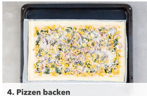
4. Pizzen backen

Den Backofen auf 220°C (200°C Umluft) vorheizen. Den Mais in einem Sieb abtropfen lassen. Die Zwiebeln schälen, halbieren und in feine Streifen schneiden. Den Knoblauch schälen und fein würfeln oder reiben. Die Limettenschale abreiben, dann die Limette halbieren und auspressen.