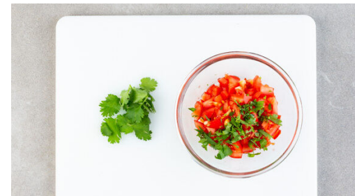
5. Salat zubereiten

Den Knoblauch in einer mittelgroßen Pfanne mit 1EL Olivenöl bei niedriger Hitze ca. 1Min. anschwitzen. Den Spinat zugeben und 1-2Min. mitbraten, bis der Spinat zusammengefallen ist. Mit je 1 kräftigen Prise Salz und Pfeffer würzen. Überschüssiges Wasser aus der Pfanne vorsichtig abgießen, dabei den Spinat mit einem Kochlöffel ausdrücken. Beiseitestellen.