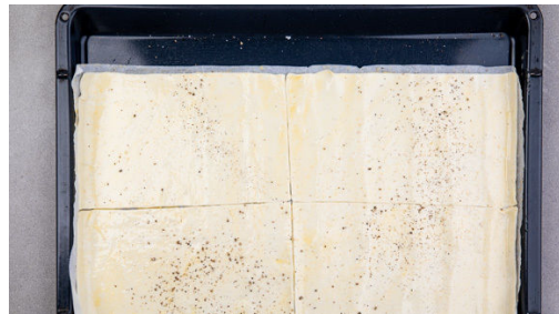
4. Fleurons backen

Den Backofen auf 240°C (220°C Umluft) vorheizen. Die Pilze ggf. säubern und vierteln. Die Karotte ggf. schälen und schräg in dünne Scheiben schneiden. Die Zwiebel schälen, halbieren und in feine Würfel schneiden. Die Lauchzwiebel in feine Ringe schneiden.