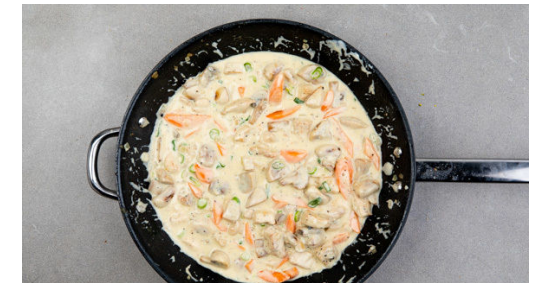
6. Frikassee fertigstellen

Das Fleisch in einer mittelgroßen Pfanne mit 1EL Olivenöl bei mittlerer Hitze 2-3Min. goldgelb anbraten. Die Pilze und die Zwiebeln dazugeben und 2-3Min. mitbraten. 1TL Mehl unterrühren, dann mit 150ml Wasser ablöschen. Die ½ des Brühwürzes dazugeben und das Frikassee 5-10Min. sanft köcheln lassen. Bei Bedarf noch etwas Wasser hinzufügen.