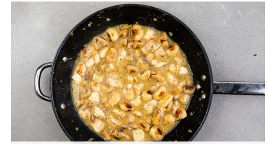
3. Frikassee ansetzen

Die Karotten in einem mittelgroßen Topf mit Wasser bedecken und leicht salzen. Die Karotten einmal aufkochen und in 2-3Min. bissfest kochen, dann in ein Sieb abgießen. Die Lauchzwiebeln untermengen und mit je 1 Prise Salz und Zucker würzen.