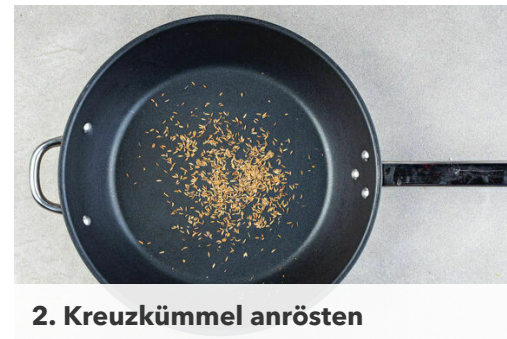
2. Kreuzkümmel anrösten

Die Crème fraîche mit 2EL Limettensaft sowie dem gerösteten Kreuzkümmel verrühren und mit Salz und Pfeffer abschmecken. Tipp: Wenn die Kids keinen Kreuzkümmel mögen, die Crème fraîche nur mit 2EL Limettensaft verrühren. Die Gurke in dünne Scheiben schneiden und mit dem restlichen Limettensaft sowie 1 Prise Salz vermengen. Ggf. etwas hellen Essig hinzufügen.