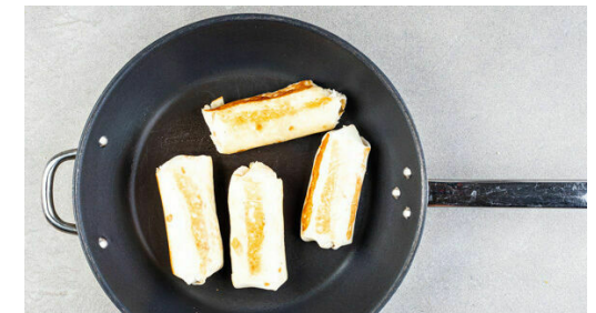
6. Wraps anbraten

Die Zwiebeln und die Paprika in derselben Pfanne mit 2EL Olivenöl bei mittlerer bis starker Hitze ca. 2Min. anbraten, dann das Hackfleisch , die Gewürzmischung und 1TL Salz hinzufügen und weitere 3-4Min. braten. Die BBQ-Sauce und 50-75ml Wasser dazugeben und 3-4Min. köcheln lassen, bis die Sauce eingedickt ist. Vom Herd nehmen und mit Salz und Pfeffer abschmecken.