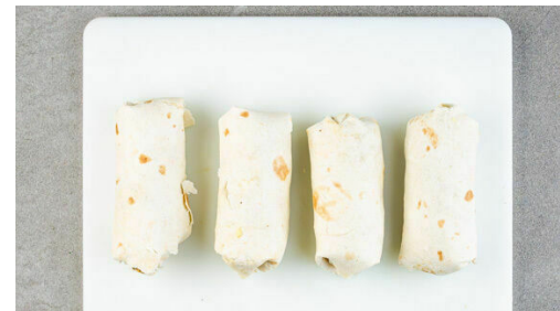
5. Tortillas füllen

Den Kreuzkümmel in einer großen Pfanne ohne Zugabe von Fett bei mittlerer Hitze 1-2Min. anrösten, dann aus der Pfanne nehmen und beiseitestellen.