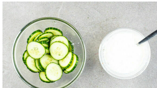
4. Salat & Dip vorbereiten

Die Zwiebeln schälen, halbieren und in ca. 1cm große Würfel schneiden. Die Paprika vierteln, entkernen und ebenfalls in ca. 1cm große Würfel schneiden. Die Limetten halbieren und eine Hälfte in Spalten schneiden, die übrigen 3 Hälften auspressen.