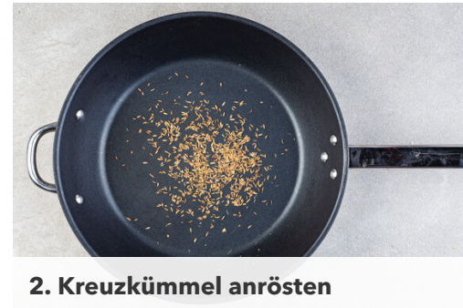
2. Kreuzkümmel anrösten

Die Crème fraîche mit 1EL Limettensaft sowie dem gerösteten Kreuzkümmel verrühren und mit Salz und Pfeffer abschmecken. Tipp: Wenn die Kids keinen Kreuzkümmel mögen, die Crème fraîche nur mit 1EL Limettensaft verrühren. Die Gurke in dünne Scheiben schneiden und mit dem restlichen Limettensaft sowie 1 Prise Salz vermengen. Ggf. etwas hellen Essig hinzufügen.