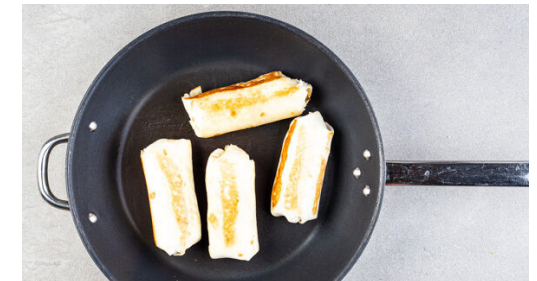
6. Wraps anbraten

Die Zwiebeln und die Paprika in derselben Pfanne mit 1EL Olivenöl bei mittlerer bis starker Hitze ca. 2Min. anbraten, dann das Hackfleisch , die Gewürzmischung und ½TL Salz hinzufügen und weitere 3-4Min. braten. Die BBQ-Sauce und 50-75ml Wasser dazugeben und 3-4Min. köcheln lassen, bis die Sauce eingedickt ist. Vom Herd nehmen und mit Salz und Pfeffer abschmecken.