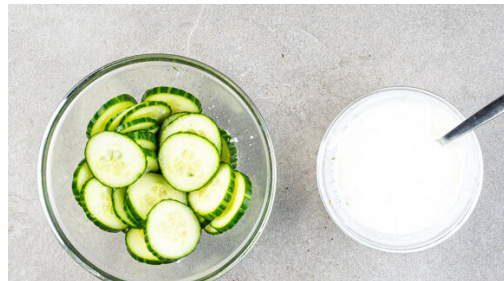
4. Salat & Dip vorbereiten

Die Zwiebel schälen, halbieren und in ca. 1cm große Würfel schneiden. Die Paprika vierteln, entkernen und ebenfalls in ca. 1cm große Würfel schneiden. Die Limette halbieren und eine Hälfte auspressen, die andere Hälfte in Spalten schneiden.