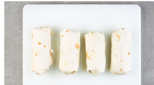
5. Tortillas füllen

Die ½ des Kreuzkümmels in einer großen Pfanne ohne Zugabe von Fett bei mittlerer Hitze 1-2Min. anrösten, dann aus der Pfanne nehmen und beiseitestellen.