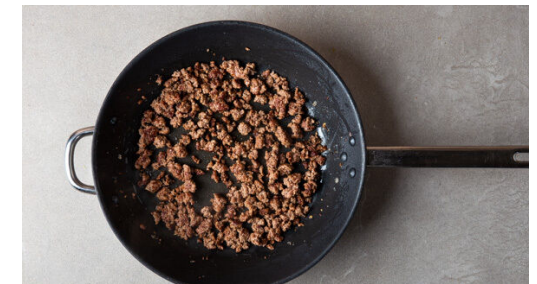
3. Hackfleisch braten

Die Karotte ggf. schälen und mit einer Küchenreibe grob raspeln.