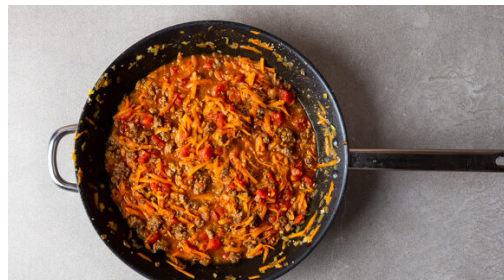
4. Sauce zubereiten

Das Hackfleisch in einer mittelgroßen Pfanne mit 1EL Olivenöl bei starker Hitze 3-4Min. krümelig anbraten. Mit je 1 Prise Salz und Pfeffer würzen.