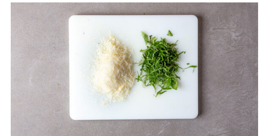
6. Garnitur vorbereiten

Die Pasta in das kochende Wasser geben und in 8-10Min. bissfest kochen. In ein Sieb abgießen und abtropfen lassen.