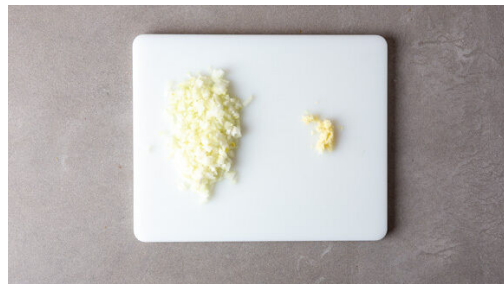
1. Zwiebel schneiden

Energie 803kcal, Fett 29.6g, Kohlenhydrate 95.3g, Eiweiß 37.1g