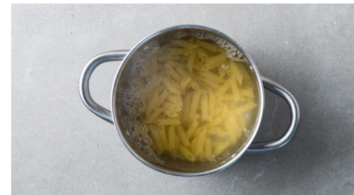
5. Pasta kochen

Die Zwiebeln , den Knoblauch und die Karotten zugeben und ca. 1Min. mitbraten. Mit 200ml Wasser und den gehackten Tomaten ablöschen. Die 1/2 des Brühgewürzes einrühren und die Sauce 10-15Min. bei schwacher Hitze köcheln. Ggf. etwas mehr Wasser hinzugeben, falls die Flüssigkeit zu schnell einkocht. Mit der Gewürzmischung , Salz, Pfeffer oder mehr Brühgewürz abschmecken.