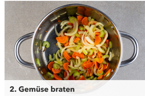
2. Gemüse braten

Das Fleisch trocken tupfen und quer in ca. 1cm breite Streifen schneiden.