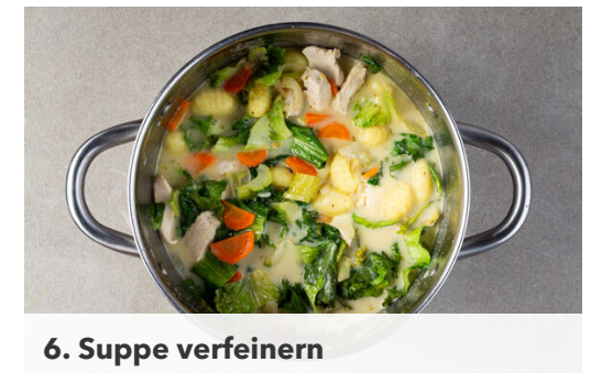
6. Suppe verfeinern

Die Endivie längs halbieren. Eine Hälfte quer in ca. 2cm breite Streifen schneiden, die andere Hälfte wird für dieses Rezept nicht benötigt. Tipp: Die übrige Endivie für einen Salat aufbewahren.