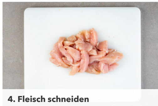
4. Fleisch schneiden

Die Zwiebel schälen, halbieren und in feine Streifen schneiden. Die Karotte ggf. schälen, längs halbieren und in dünne Scheiben schneiden. Den Sellerie quer in feine Scheiben schneiden.