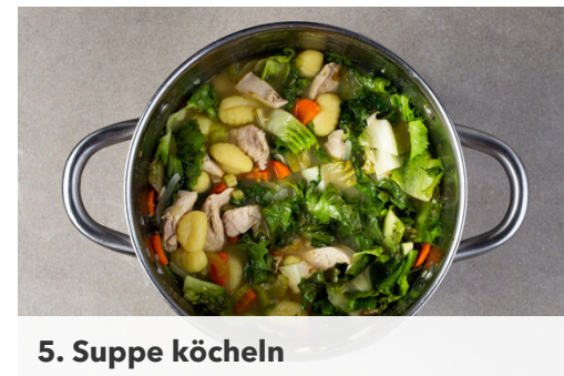
5. Suppe köcheln

Die Zwiebeln , die Karotten und den Sellerie in einem mittelgroßen Topf mit 2EL Olivenöl und 1 kräftigen Prise Salz ca. 6Min. braten, bis das Gemüse weich ist. In einem Wasserkocher 900ml Wasser zum Kochen bringen.