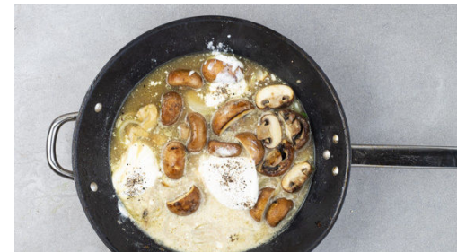
5. Crème fraîche hinzufügen

Die ½ des Brühgewürzes in 200ml heißem Wasser auflösen. Die Petersilie samt Stängeln fein hacken. Die Pilze ggf. säubern, große Pilze halbieren. Die Zwiebel schälen, halbieren und in feine Streifen schneiden. Die Pilze und die Zwiebeln in der Pfanne mit 1EL Olivenöl bei starker Hitze 3-4Min. scharf anbraten.