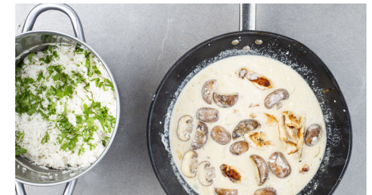
6. Sauce fertigstellen

Die Hitze reduzieren, 1EL Mehl zu den Pilzen geben und unterrühren. Die Crème fraîche hinzufügen und ca. 1Min. sanft mitköcheln lassen, dann die Brühe angießen. Die Sauce mit 1EL Senf, dem restlichen Brühgewürz sowie Salz und Pfeffer abschmecken und noch 2-3Min. leicht einköcheln lassen.