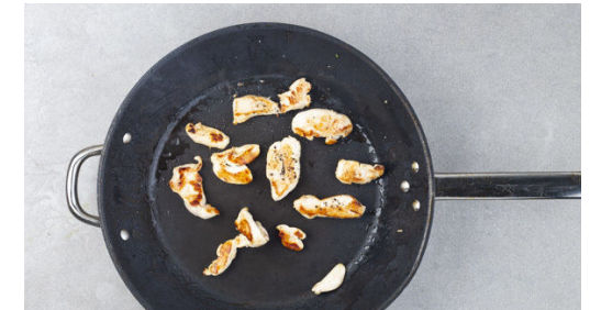
3. Fleisch anbraten

In einem Wasserkocher 500ml Wasser aufkochen. Die Karotte ggf. schälen, quer halbieren und längs in dünne Spalten schneiden. In einem kleinen Topf mit dem heißen Wasser bedecken, salzen und bei mittlerer Hitze 7-8Min. kochen, bis die Karotten bissfest sind. In ein Sieb abgießen, zurück in den Topf geben und mit 1TL Olivenöl sowie Salz und Pfeffer würzen. Bis zum Servieren warm halten.