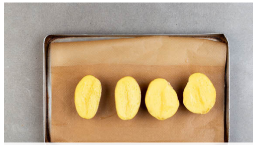
1. Kartoffeln backen

Energie 902kcal, Fett 51.6g, Kohlenhydrate 75.3g, Eiweiß 31.1g