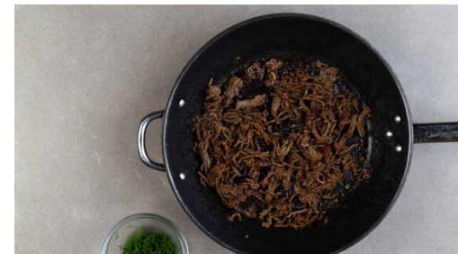
5. Hackfleisch braten

1EL Olivenöl, 1EL Balsamicoessig und je ½TL Salz und Pfeffer verrühren. Die Gurke längs halbieren und quer in dünne Scheiben schneiden. Die Rote Bete ebenfalls halbieren und in dünne Scheiben schneiden. Das Gemüse mit dem Dressing vermengen. Tipp: Da Rote Bete stark färbt, beim Verarbeiten am besten Küchenhandschuhe und Schürze tragen.