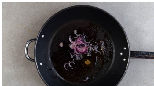
4. Zwiebeln anbraten

Den Backofen auf 220°C (200°C Umluft) vorheizen. Die Kartoffeln samt Schale längs halbieren und einige Male mit einer Gabel einstechen. Mit 1EL Olivenöl und 1 kräftigen Prise Salz einreiben und mit der Schnittfläche nach oben auf ein mit Backpapier ausgelegtes Backblech geben. Im ggf. noch vorheizenden Ofen 30-35Min. backen, bis die Kartoffeln gar sind.