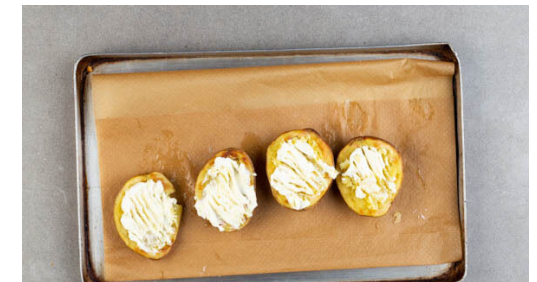
6. Kartoffeln füllen

Die Zwiebel schälen, halbieren und in feine Streifen schneiden. Die ½ der Zwiebeln unter den Salat heben.