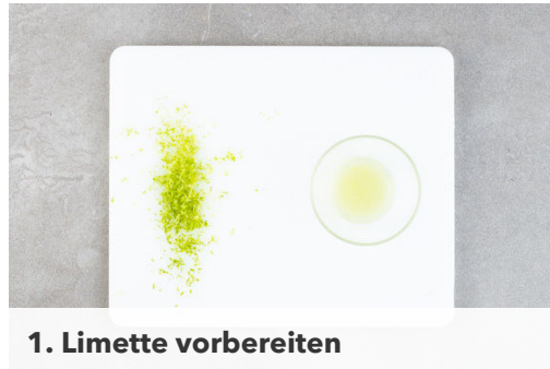
1. Limette vorbereiten

Energie 831kcal, Fett 25.9g, Kohlenhydrate 106.8g, Eiweiß 43.9g