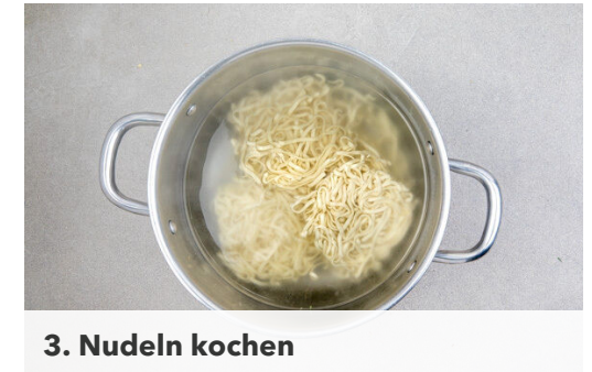
3. Nudeln kochen

Das untere Ende des Pak Choi abschneiden. Den grünen Teil des Pak Choi in breitere, den weißen Teil in dünnere Streifen schneiden. Die Karotte ggf. schälen, längs halbieren und in dünne Scheiben schneiden. Die Zwiebel schälen, halbieren und in feine Streifen schneiden. Den Knoblauch schälen und in feine Scheibchen schneiden.