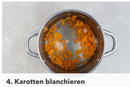
4. Karotten blanchieren

Die Nudeln in das kochende Wasser geben und in 3-5Min. bissfest kochen. In ein Sieb abgießen und kalt abschrecken.