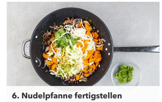
6. Nudelpfanne fertigstellen

Das Hackfleisch in einer großen Pfanne mit 1EL Pflanzenöl bei mittlerer bis starker Hitze 4-5Min. kross anbraten. Die Zwiebeln und den Knoblauch hinzugeben und 1-2Min. mitbraten. Das Hackfleisch mit der Gewürzmischung , der Limettenschale und dem Limettensaft nach Geschmack würzen und mit Salz und Pfeffer abschmecken.