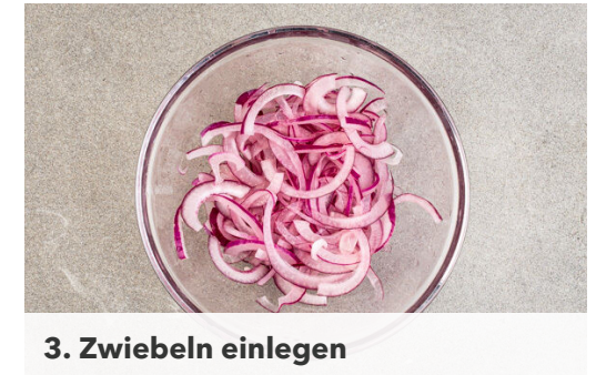
3. Zwiebeln einlegen

Das Fleisch mit 2EL Olivenöl beträufeln, in den noch vorheizenden Ofen schieben und 35-40Min. im Ofen backen. Tipp: Nach der Hälfte der Garzeit ggf. noch etwas Olivenöl über das Fleisch träufeln, um sicherzustellen, dass alle bemehlten Flächen mit Öl bedeckt sind.