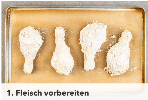
1. Fleisch vorbereiten

Energie 858kcal, Fett 47.6g, Kohlenhydrate 55.9g, Eiweiß 46.6g