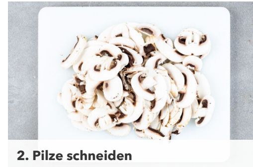
2. Pilze schneiden

Die Zwiebel und den Knoblauch schälen und grob würfeln. Den Ingwer schälen und sehr fein würfeln oder reiben.