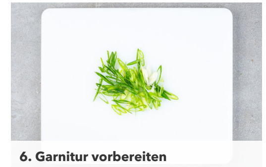
6. Garnitur vorbereiten

Den Spinat nach und nach in die Sauce geben und zusammenfallen lassen. Die Sauce nach Geschmack mit mehr Chilipaste sowie Salz und Pfeffer würzen.