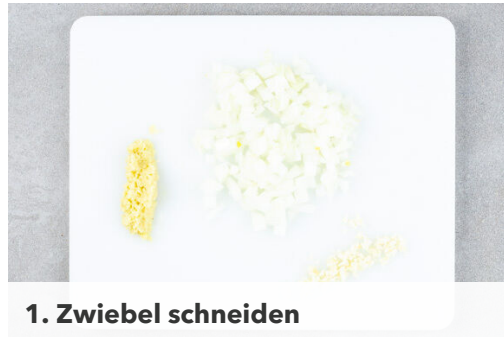
1. Zwiebel schneiden

Energie 815kcal, Fett 35.1g, Kohlenhydrate 81.1g, Eiweiß 41.9g