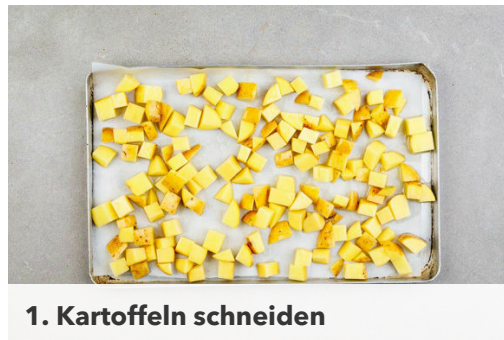
1. Kartoffeln schneiden

Energie 675kcal, Fett 33.9g, Kohlenhydrate 53.4g, Eiweiß 39.0g