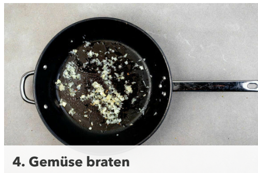
4. Gemüse braten

Die Zwiebel schälen, halbieren und in feine Würfel schneiden. Den Knoblauch schälen und fein hacken. Die Auberginen in ca. 1cm große Würfel schneiden. Die Paprika vierteln, entkernen und ebenfalls würfeln. Den Dill samt Stängeln fein schneiden.