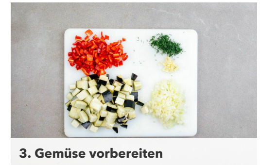
3. Gemüse vorbereiten

Die Kartoffeln mit je 1 kräftigen Prise Salz und Pfeffer würzen und ca. 15Min. im Ofen backen, bis sie goldbraun und gar sind.