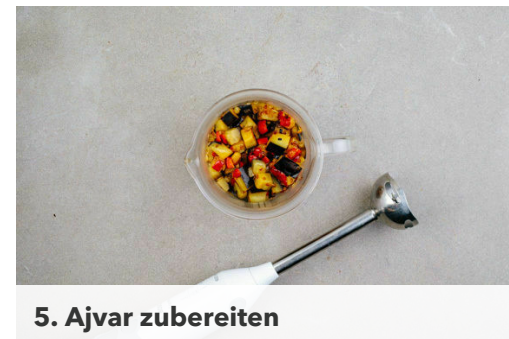
5. Ajvar zubereiten

Die Zwiebeln in einer großen Pfanne mit 1EL Olivenöl bei mittlerer Hitze 2-3Min. glasig anbraten, dann aus der Pfanne nehmen. In derselben Pfanne die Auberginen und die Paprika mit 1EL Olivenöl bei starker Hitze 3-4Min. scharf anbraten. Die Zwiebeln zurück in die Pfanne geben, den Knoblauch hinzufügen, mit 1 Prise Zucker würzen und 1-2Min. weiterbraten.