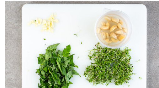
5. Creme vorbereiten

Das Fleisch und die Tomaten nach ca. 15Min. Garzeit zu dem Gemüse auf das Backblech geben und im Ofen 20-25Min. backen, bis das Fleisch gar und das Gemüse appetitlich gebräunt ist.