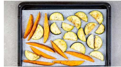
2. Gemüse backen

Den Backofen auf 220°C (200°C Umluft) vorheizen. Die Süßkartoffel samt Schale längs halbieren und in ca. 1cm dicke Spalten schneiden. Die Aubergine längs halbieren und in ca. 0,5cm dicke Scheiben schneiden. Das Gemüse auf ein mit Backpapier ausgelegtes Backblech geben.