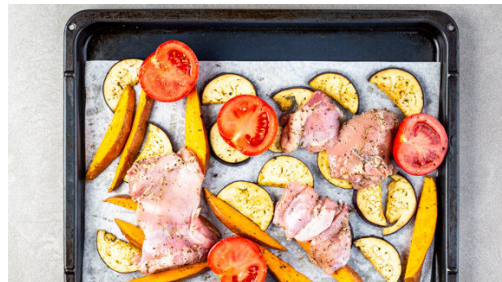
4. Fleisch und Gemüse backen

Das Fleisch trocken tupfen. Die Tomaten halbieren. Das Fleisch und die Tomaten mit 1EL Olivenöl beträufeln und mit der restlichen Gewürzmischung sowie je 1 Prise Salz und Pfeffer würzen.