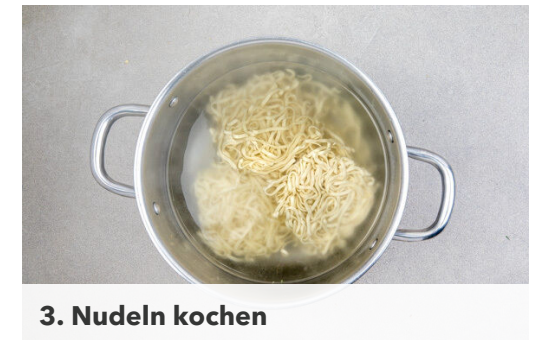
3. Nudeln kochen

Die Karotte ggf. schälen und mit einer Küchenreibe grob raspeln.