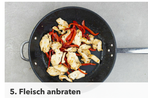
5. Fleisch anbraten

Das Fleisch trocken tupfen, jeweils längs halbieren und quer in dünne Scheiben schneiden.