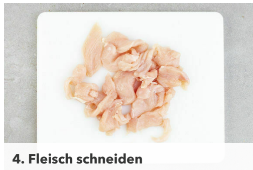
4. Fleisch schneiden

Die Nudeln in das kochende Wasser geben und in 3-5Min. bissfest kochen. In ein Sieb abgießen und kalt abschrecken.