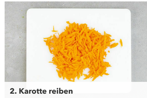
2. Karotte reiben

In einem großen Topf ausreichend gesalzenes Wasser für die Nudeln zum Kochen bringen. Die Paprika vierteln, entkernen und in dünne Streifen schneiden. Die Lauchzwiebeln schräg in feine Ringe schneiden.