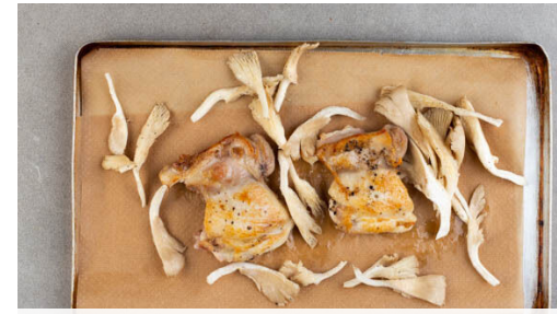
2. Pilze und Fleisch rösten

Die Austernpilze , den Lauch und den Knoblauch in der großen Pfanne bei mittlerer Hitze 2-3Min. anbraten, dann den Perlencouscous einrühren und 1-2Min. mitbraten.