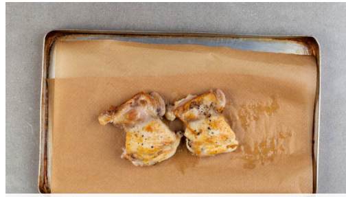
1. Fleisch anbraten

Energie 757kcal, Fett 31.4g, Kohlenhydrate 89.9g, Eiweiß 31.4g