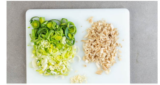
3. Zutaten vorbereiten

Den Perlencouscous nach und nach mit der Brühe ablöschen, dabei gelegentlich umrühren. Diesen Vorgang 8-10Min. lang wiederholen, bis die Brühe aufgebraucht und der Perlencouscous gar ist. Die Gewürzmischung einrühren und den Spinat unterheben, bis er zusammengefallen ist. Mit mehr Brühgewürz oder Salz und Pfeffer abschmecken.